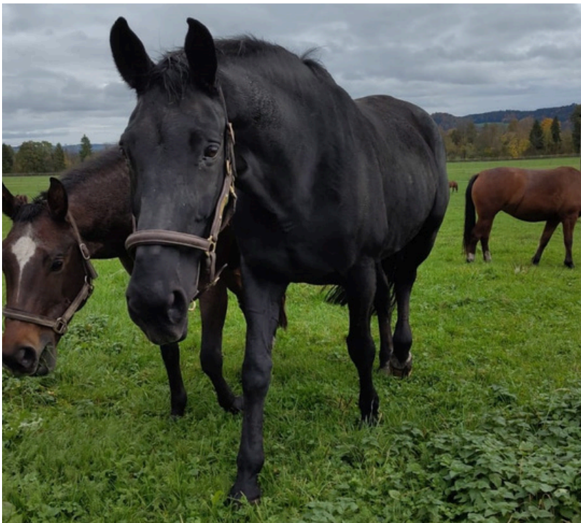
Tierhaltung, JVA Wauwilermoos

Wenn Menschen nach Orientierung in der Bibel suchen, unterstütze ich sie gerne dabei. Auch inhaftierte Menschen fragen sich, "was würde Jesus tun" oder welche Weisungen, hilfreiche Tipps für ein möglichst strafloses Leben nach der Haft, die Bibel anzubieten hat.