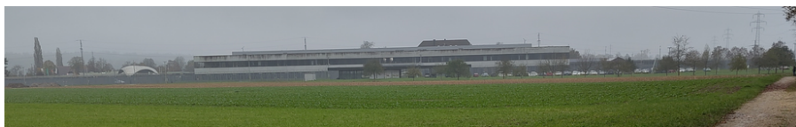
Justizvollzugsanstalt Solothurn SO