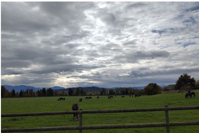
Landwirtschaftsbetrieb der JVA Wauwilermoos, mit Blick auf das Napfgebiet

Abteilung Justiz, Wohnheim Lindenfeld, Emmen: 14 Haftplätze für verschiedene Vollzugsarten.