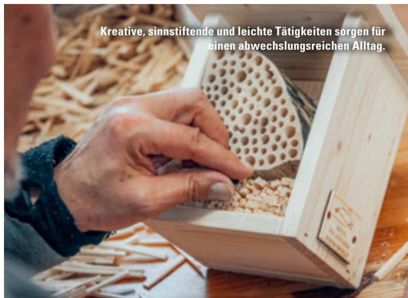
Kreative, sinnstiftende und leichte Tätigkeiten sorgen für einen abwechslungsreichen Alltag.