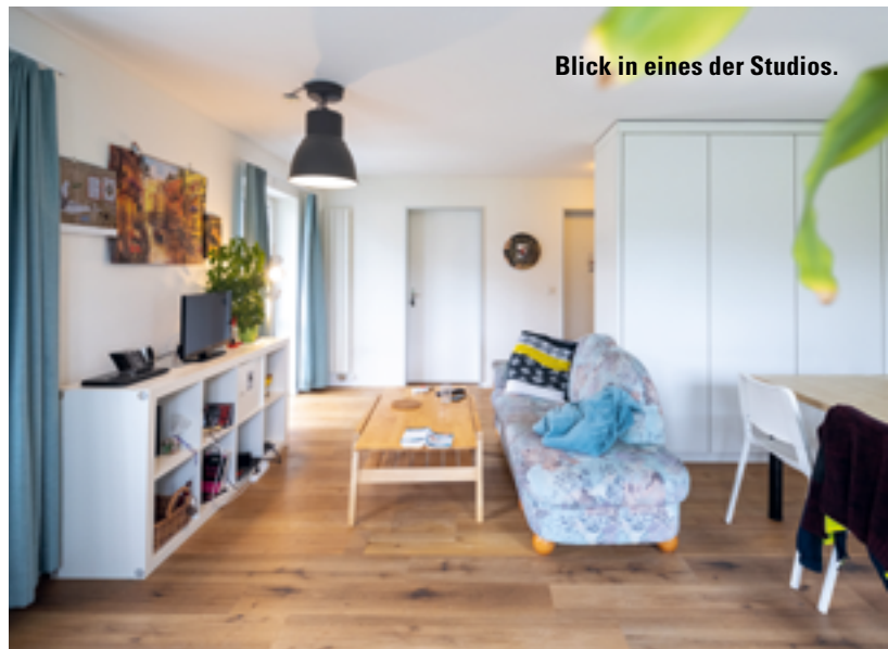
Blick in eines der Studios.