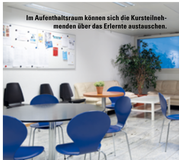
Im Aufenthaltsraum können sich die Kursteilnehmenden über das Erlernte austauschen.